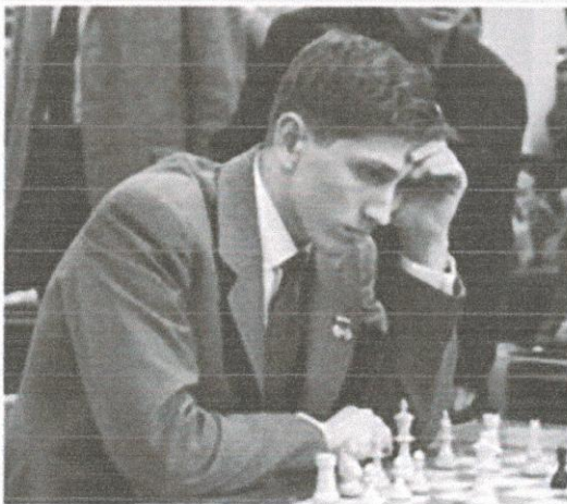
На олимпиаде в Лейпциге в 1960 году