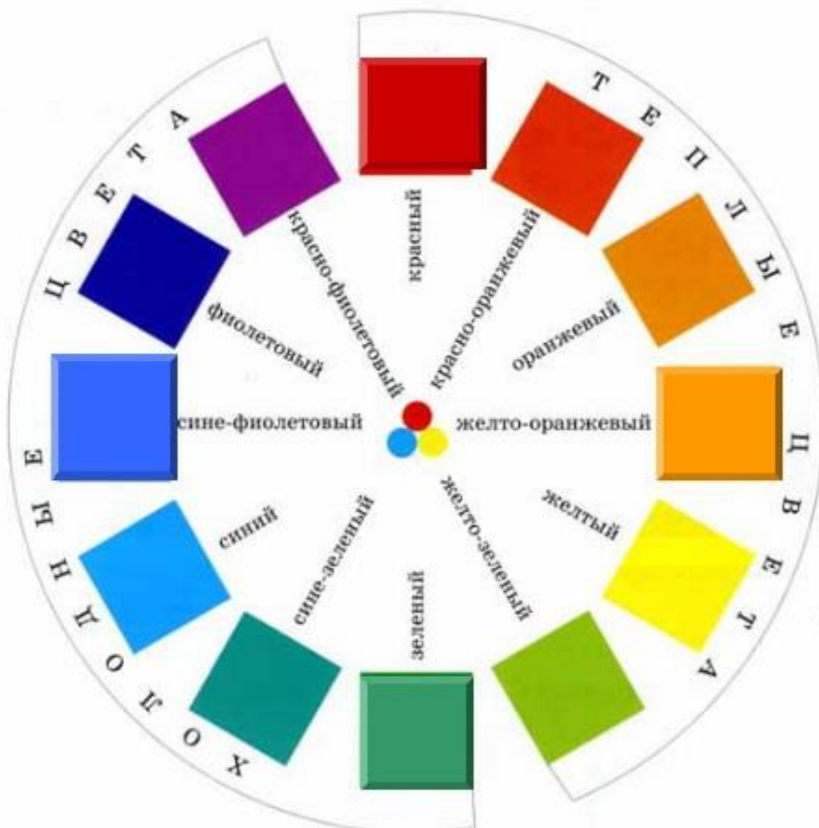
Рисунок 1 «Расположение цветов в «Цветовом круге»

Правильное сочетание цветов — одна из важных составляющих совершенного образа и стильного и целостного решения при выборе одежды (может использоваться в дизайне интерьера).